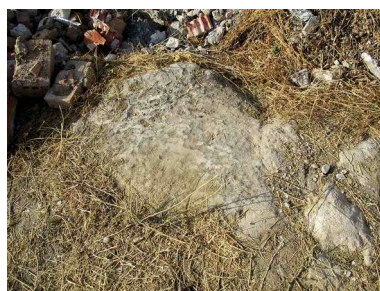
Piedra del cargadero