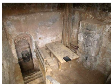
Pila de la uva

En la pila de la uva se ha realizado el acceso actual a la bodega, siguiendo el trazado de la canilla que antiguamente comunicaba dicha pila con la pila del mosto. Esta última se emplaza bajo tierra, y en ella se observa el revoco en la parte inferior de las paredes.