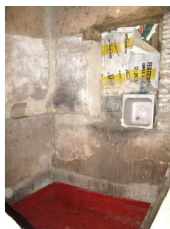
Descargadero y pila de la uva