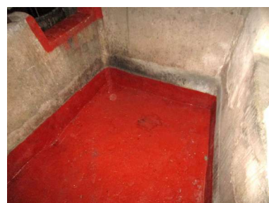
Pila de la uva