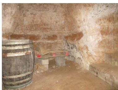
Pila del mosto subterránea