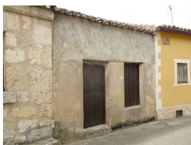
Exterior de la tina

Se trata de una tina o lagareta, en la que el prensado se realiza mediante una prensa de husillo. Está emplazada en una edificación a la que se accede desde la Calle Alta.