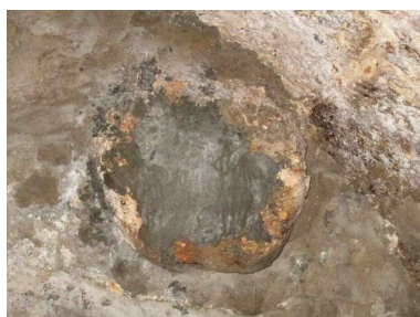
Canilla de piedra