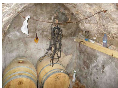
Pila del mosto subterránea

Ninguna persona de las consultadas recuerda el emplazamiento de un lagar en este espacio, por lo que pudo ser desmontado hace más de un siglo. La única evidencia actual de la existencia de un lagar se trata de la canilla de piedra situada en el primer mincho de la bodega subterránea, el cual serviría como pila para el mosto. Esta configuración es común en los lagares de la localidad. En el plano general se representa una hipótesis de la disposición del resto de los elementos del lagar.