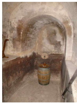
Pila de mosto subterránea