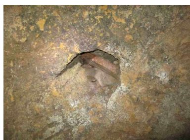
Canilla a bodega

La denominación de esta edificación como “La Tina” puede hacer alusión a la antigua existencia de un pequeño lagar, probablemente con prensa de husillo en lugar de viga. En la bóveda de la nave de la bodega existe un pequeño agujero actualmente taponado que podría servir para el trasiego del mosto desde la pila.