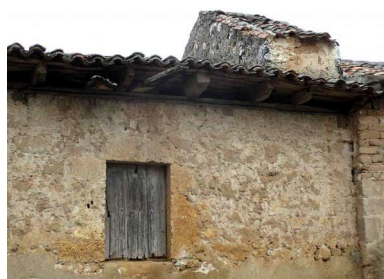
Portajón y Cargadero

Se observan los dos portajones de descarga de la uva, uno en cada fachada. En el interior se aprecian las trazas de la pila de la uva. Conserva parte de su aspecto tradicional.